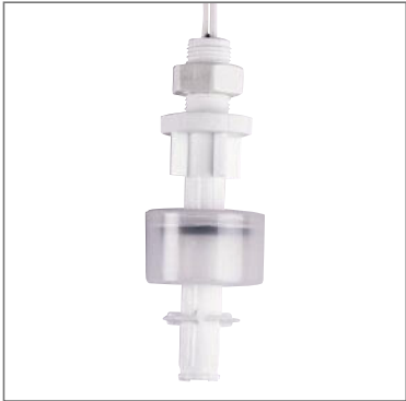
P003 AC-100 / AC-500