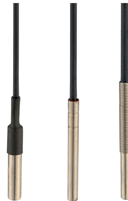
Esempio soluzioni disponibili Example of available solutions