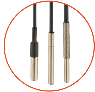
Beispiel für verfügbare Lösungen Example of available solutions